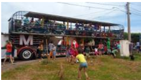
Tradicional campanha das BOLAS - todas na véspera de NATAL