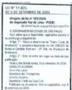
PASSARELA LIONS CLUBE Rodovia Candido Portinari 09/setembro/2004