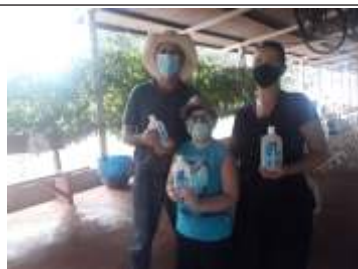
Distribuição de Álcool em gel no Pesqueiro do Deleone.