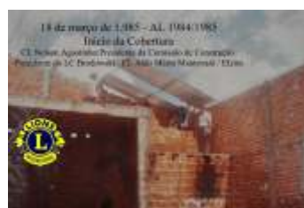
Inicio da cobertura do Centro Social 18/3/1985 - AL 1984/1985 - Pres.: CL ALDO MÁRIO MANTOVANI