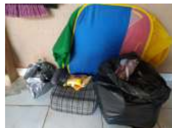
Doação anônima do Condomínio Esmeralda, brinquedos, sapatos, utensílios, fubá e cadeirinha