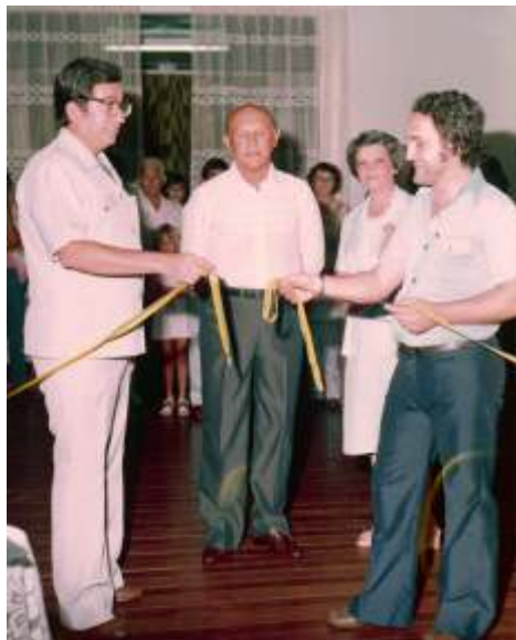
Apadrinhamento do LC DE JARDINOPÓLIS ( 27/05/1980) e desativado em 1.984