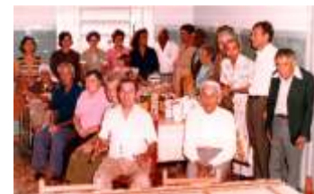
Assistência ao Asilo Lar da Fraternidade, no AL 1978/1979