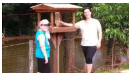
Fornecimento de água e alimentação a aves e animais silvestres.