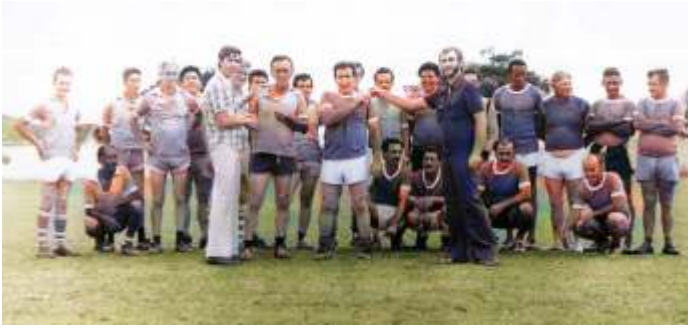
1a. promoção - março / 1977 - JOGO BENEFICENTE