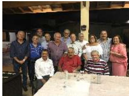
Grupo de Leões