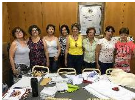
Voluntárias da Costura