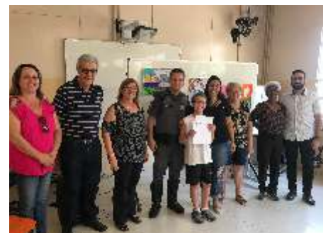
Premiação Concurso de Cartaz Sobre a Paz