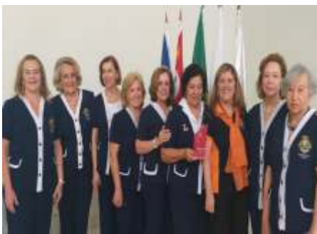
Grupo de Domadoras