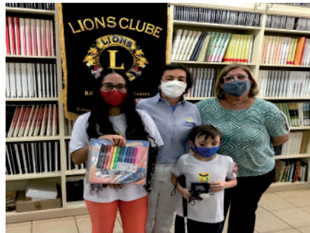
Premiação na ADEVIRP