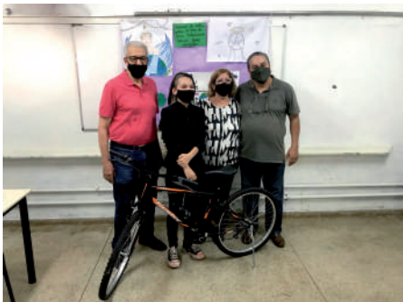
Premiação no SESI