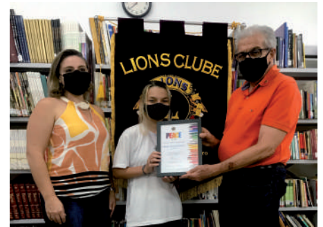
Premiação no SESI