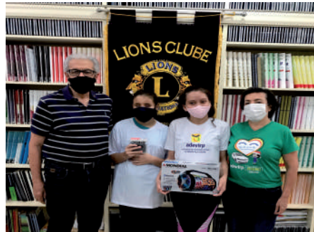
Premiação na ADEVIRP