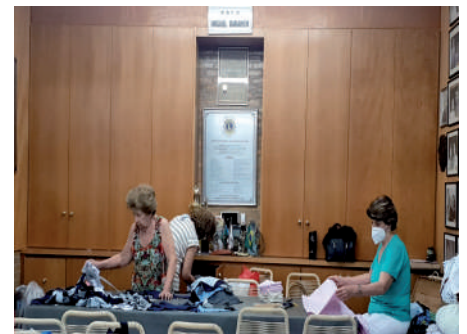
Trabalho de Costura, na Sede