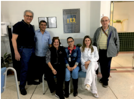
Visita ao Centro Clínico da Santa Casa (Obra do Clube - Memória)