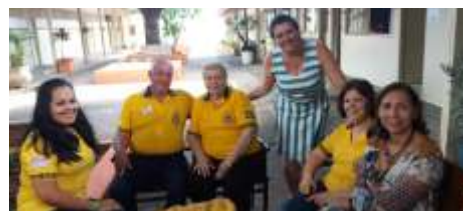
24 de Janeiro 10ª. Capacitação Lions Quest em São José do Rio Preto