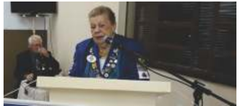
08 de Janeiro Lions Clube de Guariba