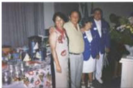
Visita Governador - Mendoia