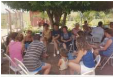
Confraternização - 2000