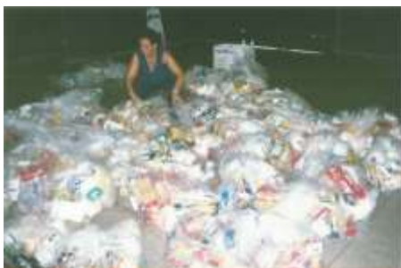
Cestas para o Natal - 2005