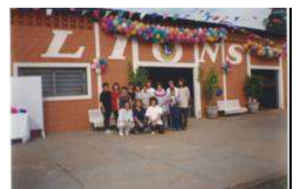
Reunião - 2005 - nossa Sede