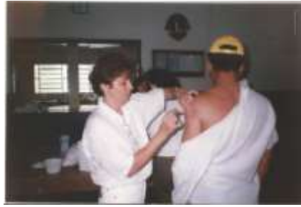
Vacina Febre Amarela - Lions