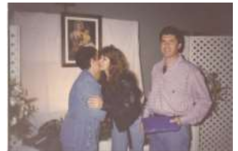
Dia das Mães - 1998