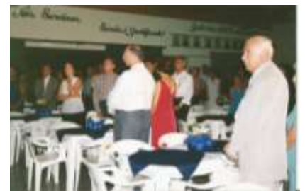
Reunião festiva- 1998