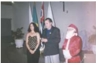
Natal de 2000