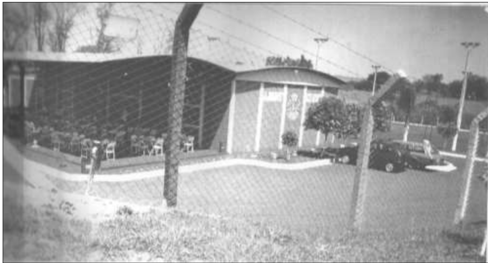
Nossa Sede inicio - 1985 - construção Saída Ibirá - Rod. Abel Pinho Maia Km. 13