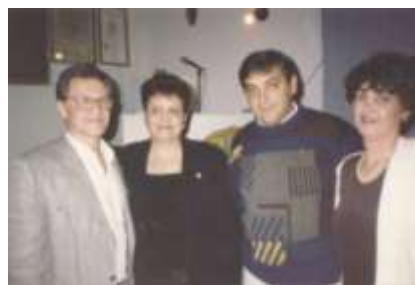
Confraternização - 2001