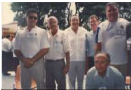
Convenção - Sertãozinho - 1998