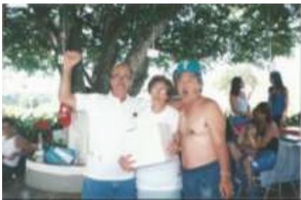
Confraternização - 1999