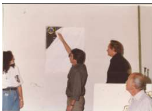
Emplacamento da Sede - 1991