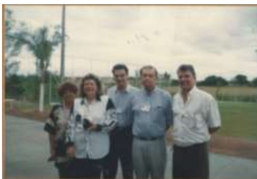
Comitê Assessor =1997 - Nossa Sede