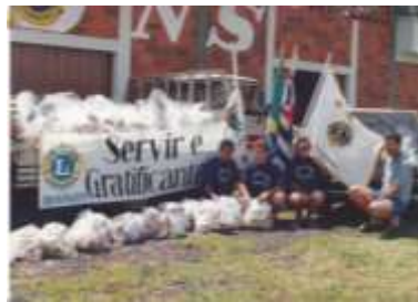
Campanha do Alimento- 1993