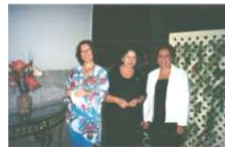
Jantar dançante - 2004