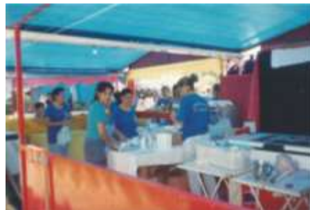
Festa das Nações - 2003