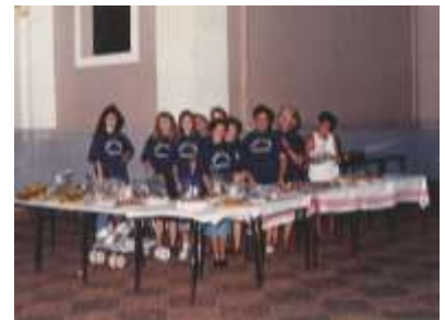
Bazar da sobre mesa-1996