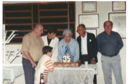
Aniversário do Lions 35 anos