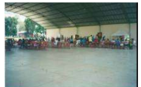
Acampa- Leo - 2002