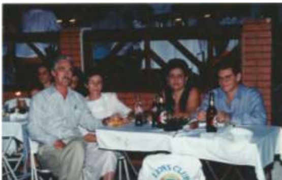
Jantar Dançante- 1995