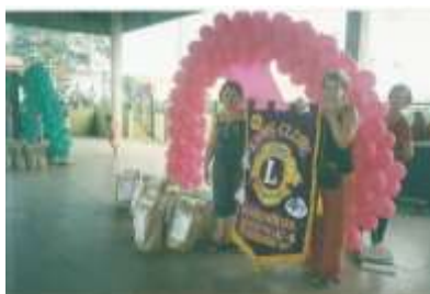
Dia da criança - 2005