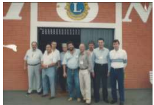
Comitê Assessor - 2.000 - nossa Sede