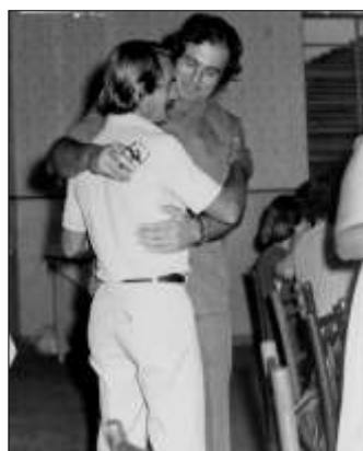
CL. Governador Dante Biuscardi Presidente CL. Chico Riva - 1976