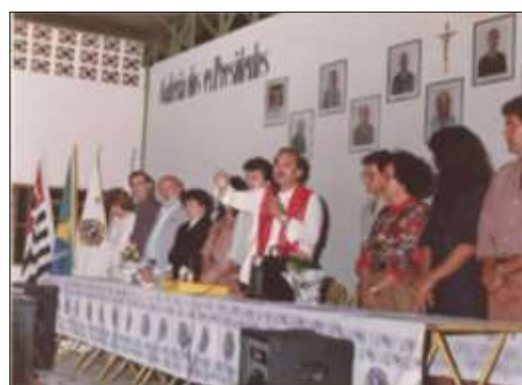
Padre benzendo a Sede - 1991