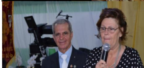
50 anos LC – Palmeira d'Oeste, 2018