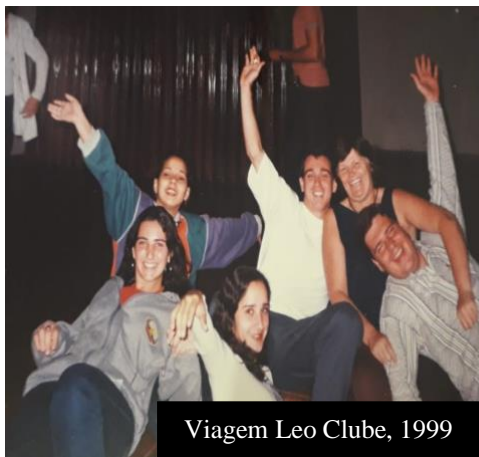
Viagem Leo Clube, 1999