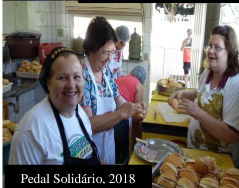
Pedal Solidário, 2018