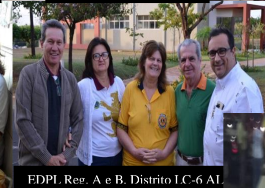
FDPL Reg. A e B. Distrito LC-6 AL