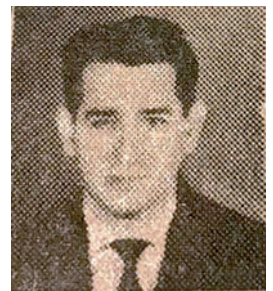
CL Primo Paterno In Memoriam

À noite, após um dia de labor, lutas, vivência contínua no ambiente normal de nossas atividades, aprendemos a fazer uma ligeira pausa, e, em silêncio, ao recostar nossas cabeças ao travesseiro, perguntamos: "Fui hoje útil ao meu semelhante"?