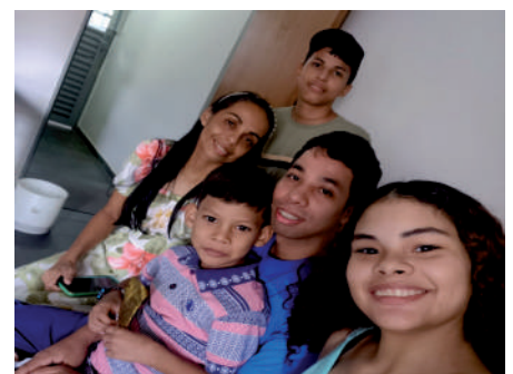
Reencontro de Família Venezuelana promovido pelo Clube