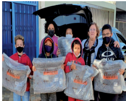
Doação de cobertores - Distrito Quente