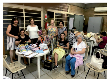
Equipe da Costura