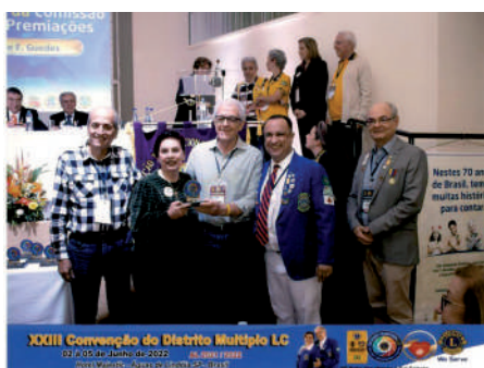
Momento de premiação - Convenção DMLC