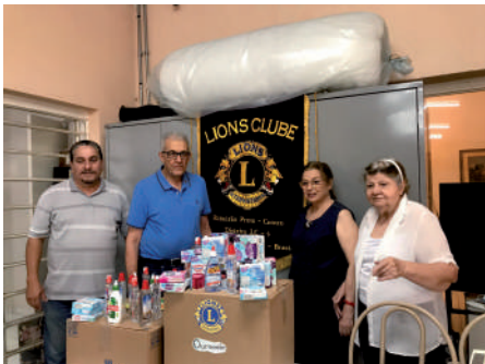
Doação de gelatina diet e adoçante para Abraccia