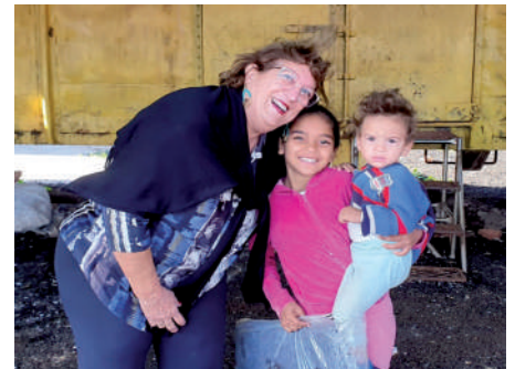
Doação de cobertores - Distrito Quente