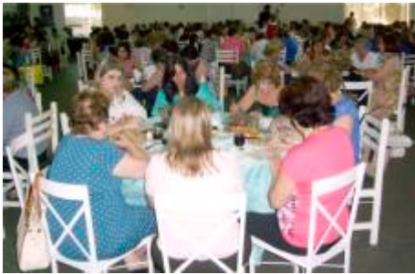
Momento de concentração

Cerca de 350 mulheres da sociedade ribeirãopretana, participaram da Tarde Beneficente promovida pelas Domadoras do Clube, no dia 12 de agosto, no Salão de Eventos da Fundação Rotária. Esse evento acontece todos os anos e tem por objetivo, a obtenção de recursos para a aquisição de matéria prima utilizada na confecção de enxovais para recém-nascidos, doados a gestantes carentes da comunidade. A promoção correspondeu plenamente às expectativas e foi bastante elogiado pelas pessoas que lá compareceram.