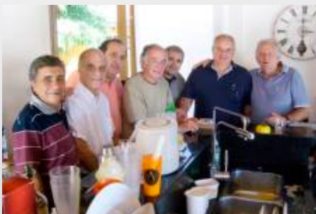
Grupo de Leões