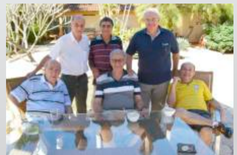
Grupo de Leões