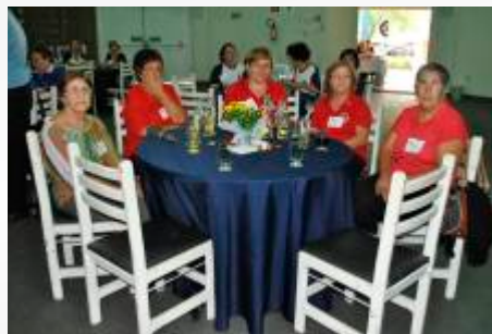
Domadoras - Lions Ribeirão Preto Ipiranga