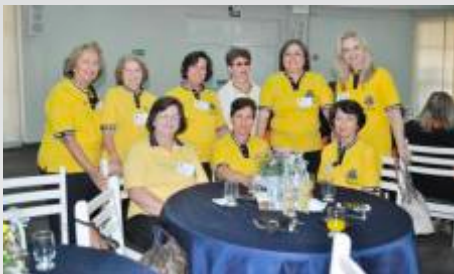
Domadoras - Lions Sertãozinho