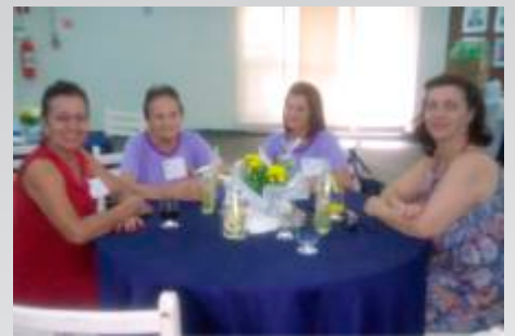
Domadoras - Lions Brodowski e Altinópolis