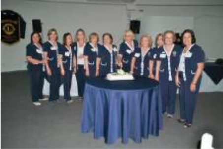
Domadoras - Lions Ribeirão Preto Centro