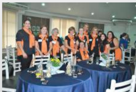
Domadoras - Lions Ribeirão Preto Jardim Paulista