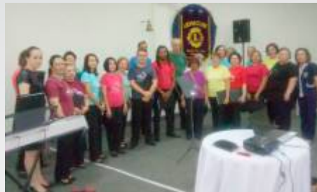
Coral da Associação de Engenharia e Arquitetura