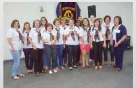
Domadoras - Lions Cravinhos