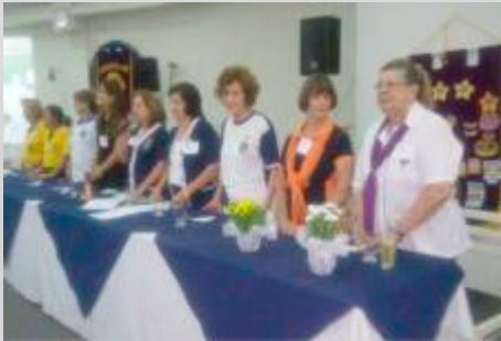
Componentes da Mesa Diretiva