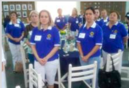
Domadoras - Lions Ribeirão Preto Campos Elíseos