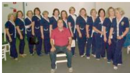
Amir e Grupo de Domadoras